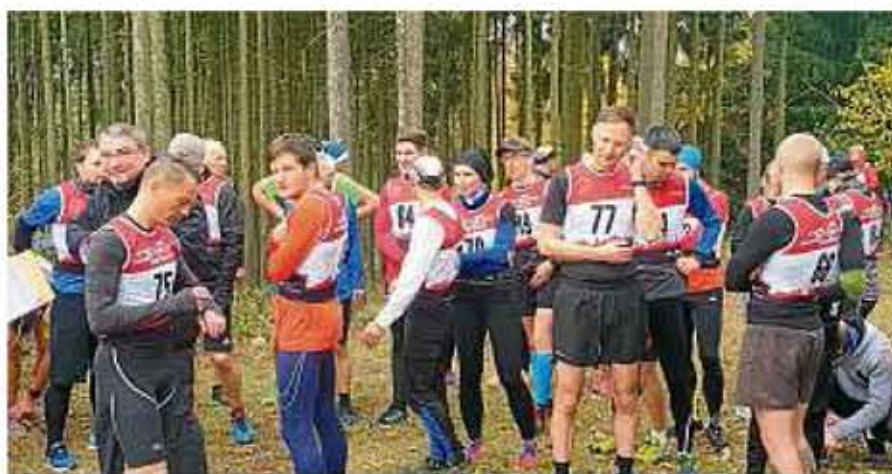
Nervöse Erwartungen auf den Start der Herren über zehn Kilometer beim Triebeser Herbstcrosslauf 2018.