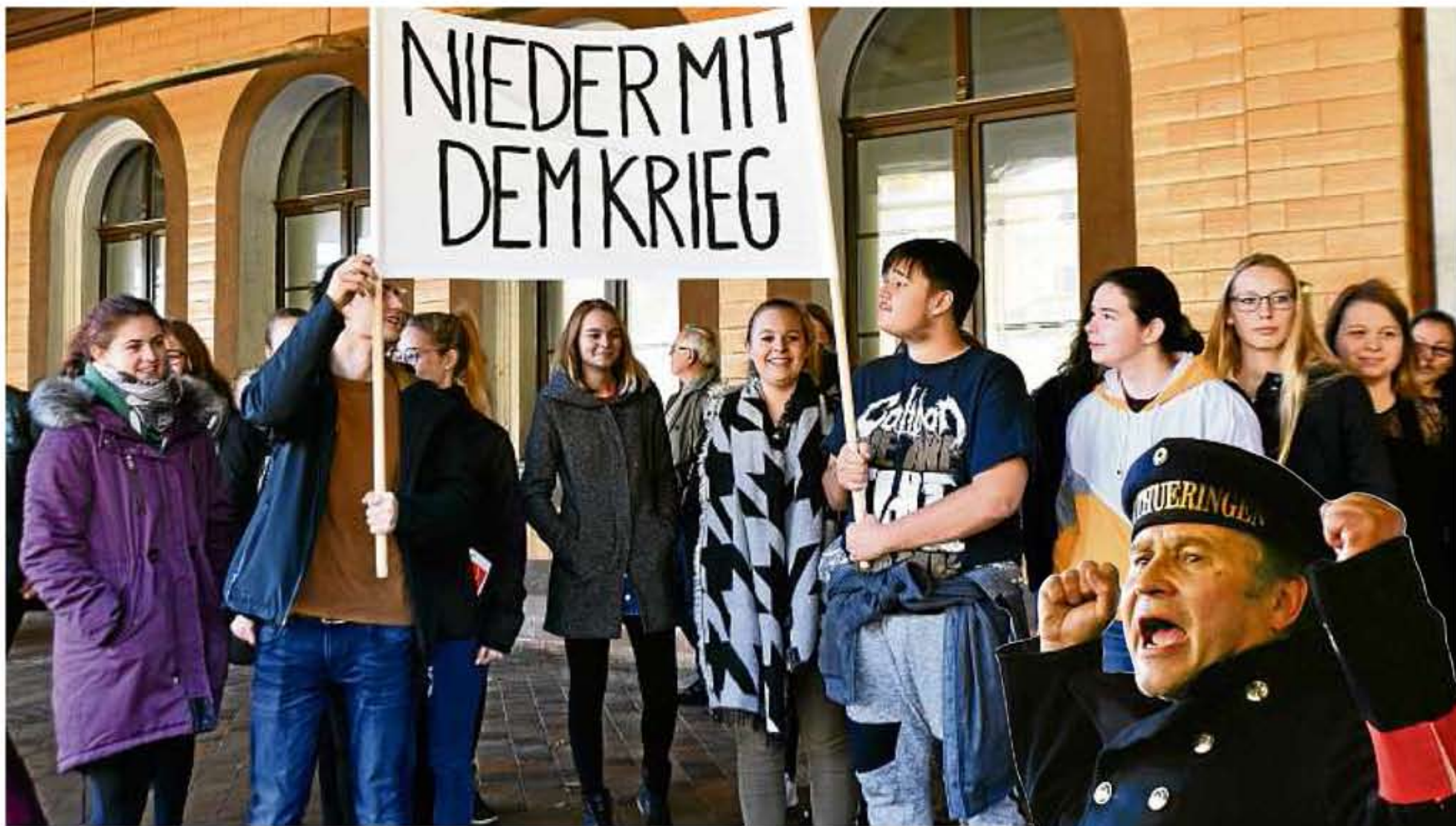
Um die Situation ein wenig authentischer zu machen, wurden Banner an die Gäste verteilt, unter denen auch viele Schüler waren.

Um telefonische Anmeldung bis spätestens 4. Dezember wird unter (03447) 58 02 04 gebeten.