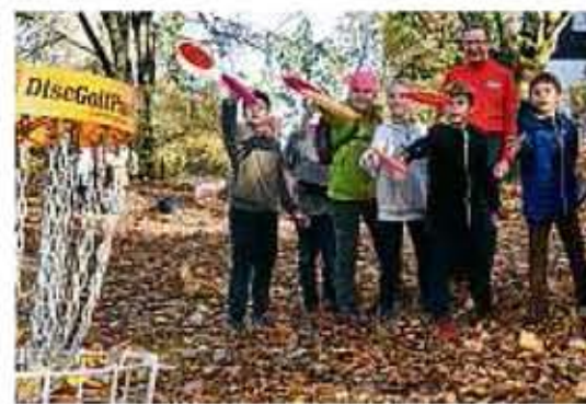
Die Greizer Schüler versuchten sich gleich einmal.