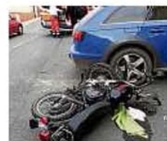
Der Unfallort.

Zeulenroda-Triebes. Zu einem schweren Unfall kam es am Dienstag, 15.10 Uhr, in der Schopperstraße in Zeulenroda-Triebes. Ein 58-jähriger Audi-Fahrer bog von der Schopperstraße nach links in die Dr.-Gebler-Straße ein und übersah den 15-jährigen mit seiner Simson. Dieser hatte Vorfahrt. Der Jugendliche wurde beim Zusammenstoß schwer verletzt und musste mit dem Rettungshubschrauber in ein Klinikum geflogen werden. Der Autofahrer blieb unverletzt. Beide Fahrzeuge wurden beschädigt. Der Rettungshubschrauber landete auf der Freifläche am Kreisverkehr Richtung Triebes. Mit fünf Einsatzkräften war die Stützpunktfeuerwehr Zeulenroda an der Unfallstelle, um die auslaufende Flüssigkeit zu binden. (red)