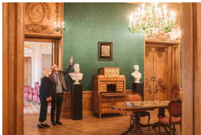
Der Grüne Salon gehört zum Herzstück des Museums.

Die ehemaligen Wirtschaftsräume für den fürstlichen Hof beherbergen seit 1998 eine Ausstellung zur Herstellung und Geschichte des Greizer Textilwesens.