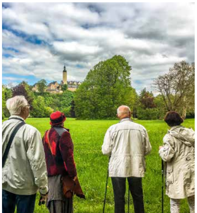
Im Fürstlich Greizer Park