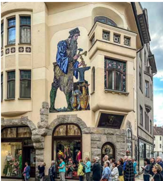
Stadtführung durch Greiz

Mehrmals im Jahr bietet die Tourist-Information eine Vollmondführung mit allerlei Sagenhaftem & Geheimnisvollem durch den Park an. Rechtzeitige Anmeldung empfohlen.