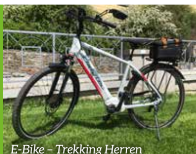
E-Bike – Trekking Herren