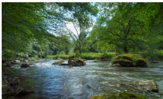
Die Weiße Elster – von wild-romantisch bis sanftmütig