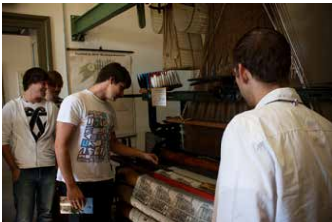
Historische Webstühle im Unteren Schloss