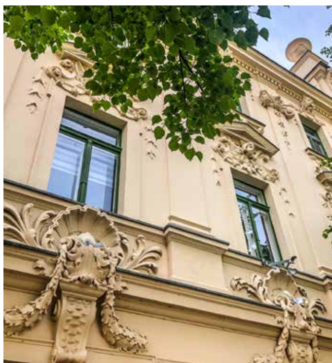
Die Greizer Neustadt verführt mit Bauwerken des 19. Jahrhunderts, vorwiegend der Gründerzeit entsprechend.