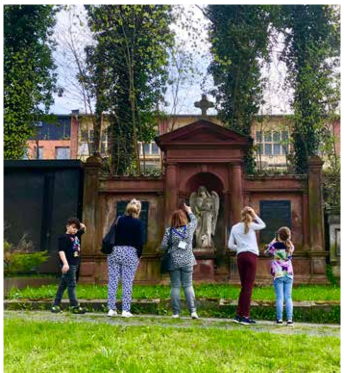
Führung auf dem Greizer Friedhof