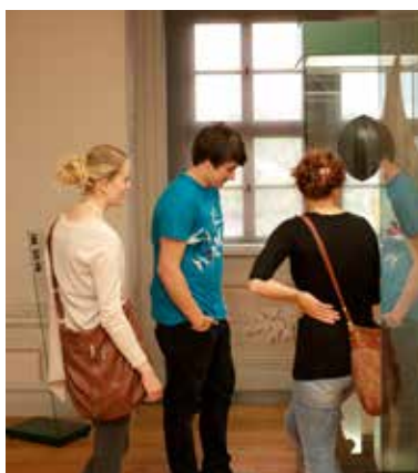
Besucher auf Entdeckungstour im Museum Oberes Schloss