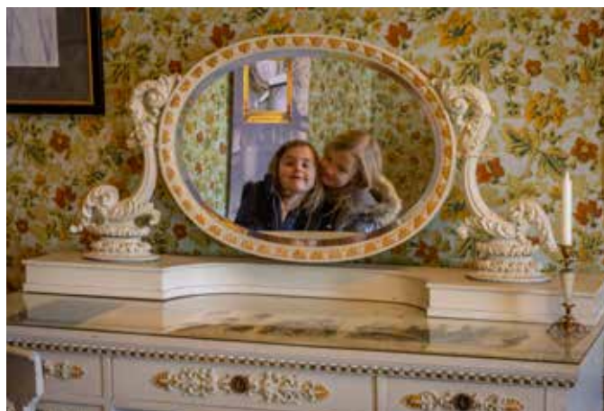
Im Ankleidezimmer der Fürstin Ida entdecken zwei junge Damen den Zauber vergangener Eleganz.