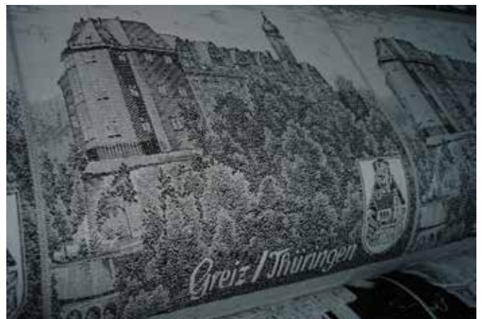
Webbild im Textilmuseum Greiz