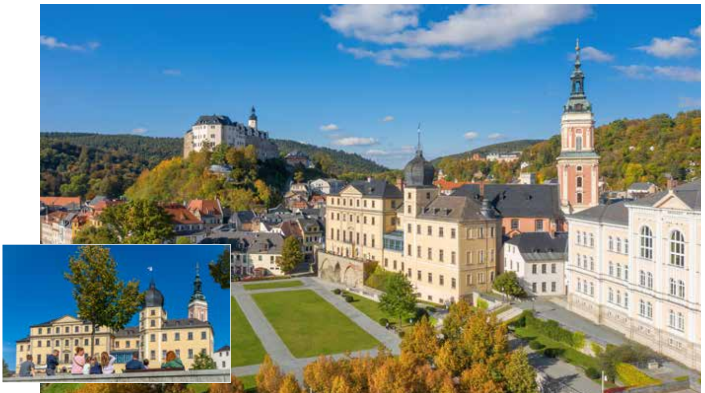
Blick auf das innerstädtische klassizistische Ensemble mit Unteren und Oberen Schloss

Nach dem Umzug der Reußischen Fürsten 1809 in das nach dem Stadtbrand von 1802 wieder aufgebaute Untere Schloss wurde das Obere Schloss Sitz der Regierungsbehörden des Fürstentums Reuß älterer Linie. Der Wiederaufbau des Unteren Schlosses erfolgte damals im streng klassizistischen Stil. Der letzte Nachkomme, Fürst Heinrich XXIV. Reuss Älterer Linie (1878-1927), erhielt das Wohnrecht im Unteren Schloss bis zu seinem Tod 1927. 1929 wurde das Museum in den Räumen des Unteren Schlosses, der Bel-étage, eingerichtet. Im Seitenflügel des Unteren Schlosses befindet sich die Ausstellung „Greizer Textil – Vom Handwerk zur Industrie“.