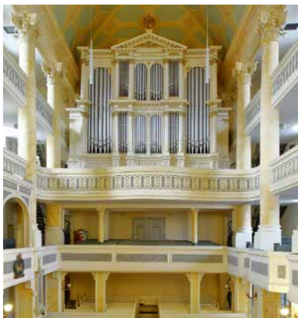
Die Kreutzbach-Jehmlich-Orgel in der Stadtkirche