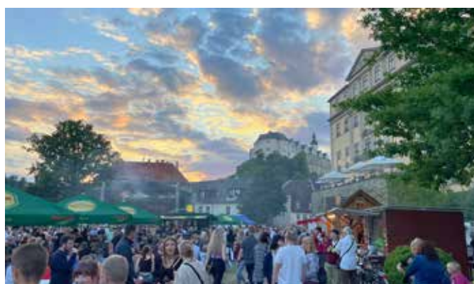
Jedes Jahr am 2. Juniwochenende lockt das Park- und Schlossfest überregionales Publikum