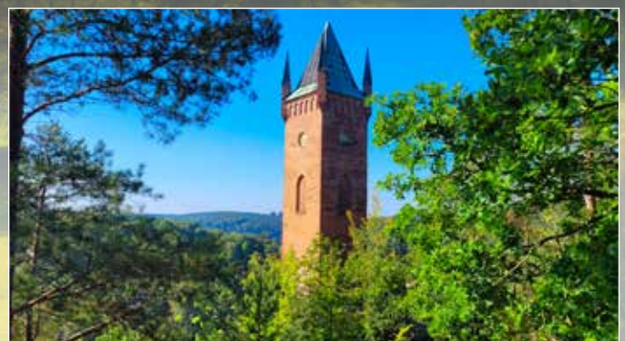
Das Weiße Kreuz und der Pulverturm gehören zu den beliebtesten Aussichtspunkten in Greiz