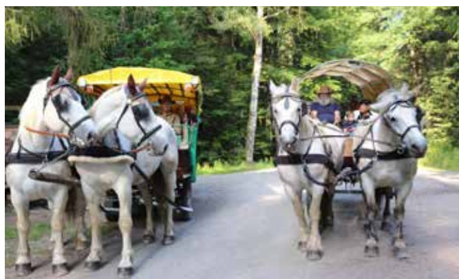
Kremserfahrten im Werdauer Wald