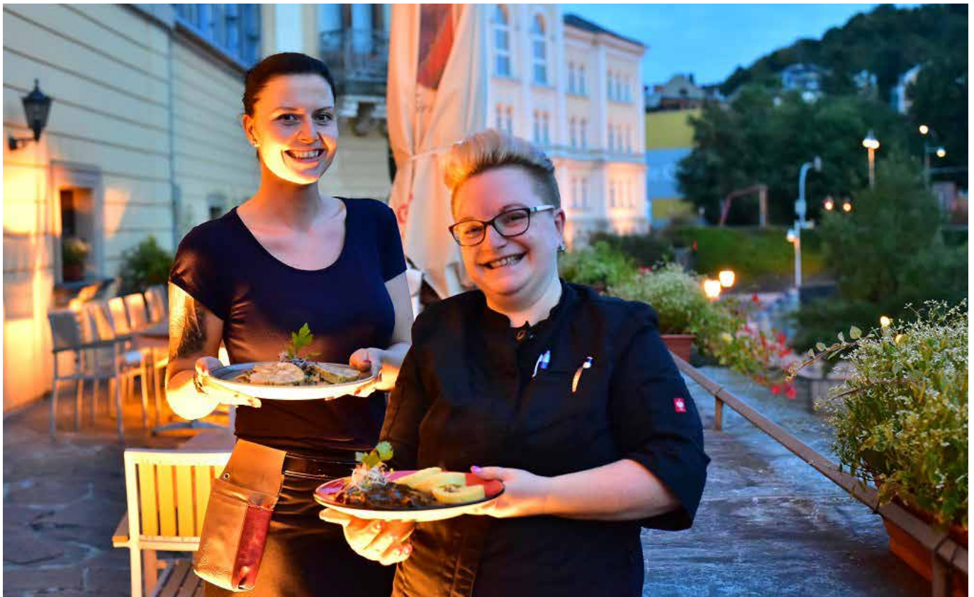
Nach einem Besuch im Museum kann man sich in den Sommermonaten auf der Terrasse der „Harmonie“ verwöhnen lassen.

Museum im Unteren Schloss Greiz, 07973 Greiz Telefon: +49 3661 703411 · E-Mail: museum@greiz.de www.greiz.de