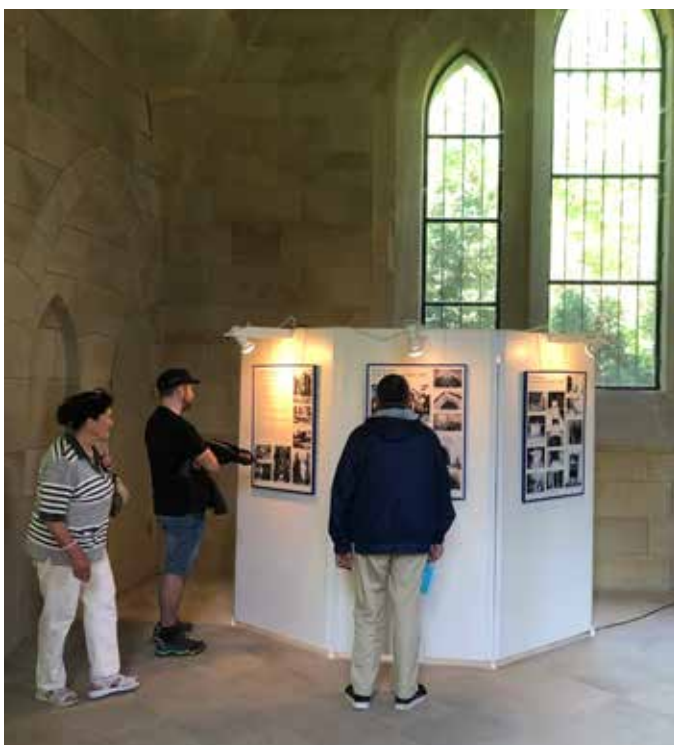
kleine Ausstellung im Mausoleum

Diese Art der Stadtführung ist für alle Menschen geeignet, die in ihrer Mobilität eingeschränkt sind (slow goes/no goes). Ob zur privaten Geburtstagsfeier oder als Programmpunkt im Pflege- oder Seniorenheim: Wir bringen Ihnen Greiz virtuell in Ihren Räumlichkeiten näher. Bei unserem Stadtrundgang im Sitzen gehen Sie trotzdem mit uns auf Tour und erfahren Wissenswertes zur Stadtgeschichte sowie Geschichten und Anekdoten aus dem alten Greiz anhand zahlreicher Illustrationen. Lehnen Sie sich zurück und genießen Sie eine Stadtführung der besonderen Art.