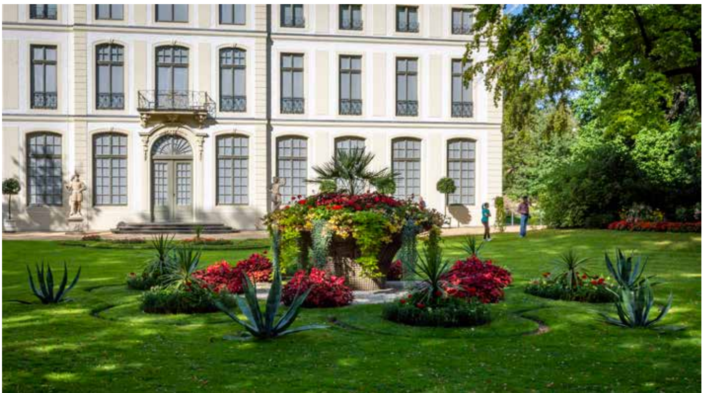
Blumenarrangement vor dem Sommerpalais im Fürstlich Greizer Park

Die Geschichte des Fürstlich Greizer Parks reicht bis in die Mitte des 17. Jahrhunderts zurück. Ursprünglich befand sich am Fuße des Schlossberges bis hin zur Weißen Elster ein Küchengarten, der jedoch von der Herrschaft wenig genutzt wurde. Erst mit der Errichtung des Vorgängerbaus des heutigen Sommerpalais um 1714 wurde auch der Garten gestaltet. Ab 1800 ließ Fürst Heinrich XIII. Reuss Aelterer Linie (1747–1817) den Park nach englischem Vorbild umgestalten. Sein Sohn Heinrich XIX. (1790–1836) beauftragte den kaiserlich-königlichen Schlosshauptmann Johann Michael Riedl von Leuenburg aus Laxenburg bei Wien mit umfangreichen Arbeiten. Die nächsten gestalterischen Impulse für den Landschaftsgarten kamen schließlich im Zuge des Eisenbahnbaus vom berühmten Muskauer Gartendirektor Carl Eduard Petzold. Dieser erhielt 1872 den Auftrag, Pläne für den Park und die Bahnanlage zu entwickeln. Petzolds Pläne wurden von seinem Schüler Rudolph Reinecken modifiziert. Ab 1873 prägte Reinecken, der insgesamt 50 Jahre in Greiz tätig war, die Entwicklung des Parks nachhaltig.