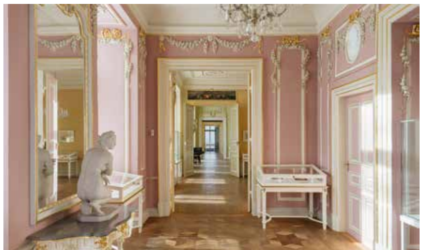
Rosa Kabinett mit Enfilade