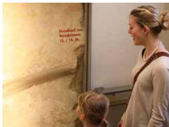
Besucher betrachten den historischen Handlauf