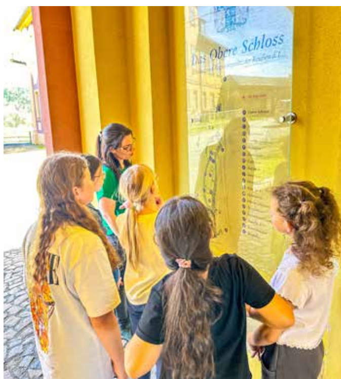
Sagenführungen sind bei Jung und Alt sehr beliebt