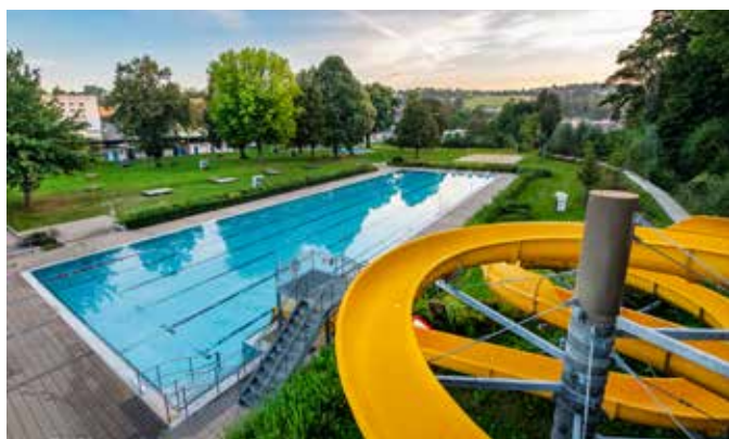
Blick über das Sommerbad Greiz

E-Mail: info@kajakfreizeit-greiz.de · www.kajakfreizeit-greiz.de