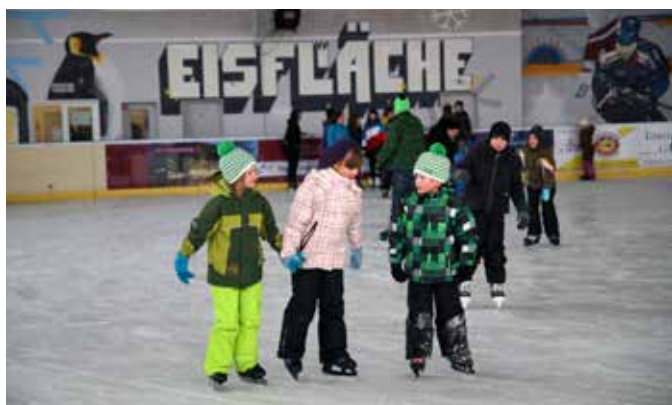
Winterliches Vergnügen auf der Eisfläche

E-Mail: lsv-greiz@luftsportverein-greiz.de