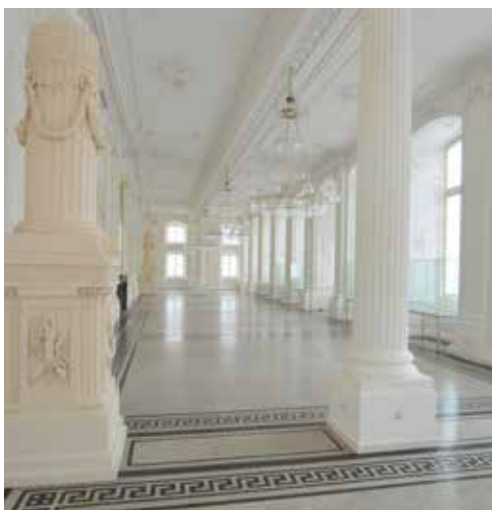
Blick in den Gartensaal des Sommerpalais

► TIPP: Highlight - Der „Winterzauber im Sommerpalais“, ein eintägiger Adventsmarkt im einmaligen Ambiente des Gartensaals, findet immer am Sonnabend vor dem 2. Advent von 10 - 17 Uhr statt.