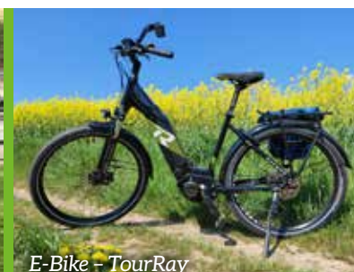
E-Bike – TourRay