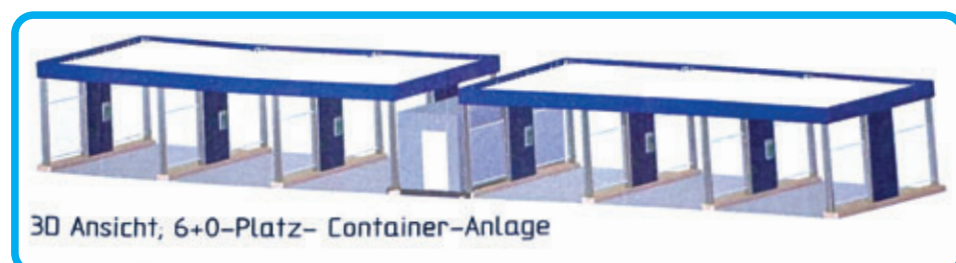
3D Ansicht, 6+0-Platz- Container-Anlage