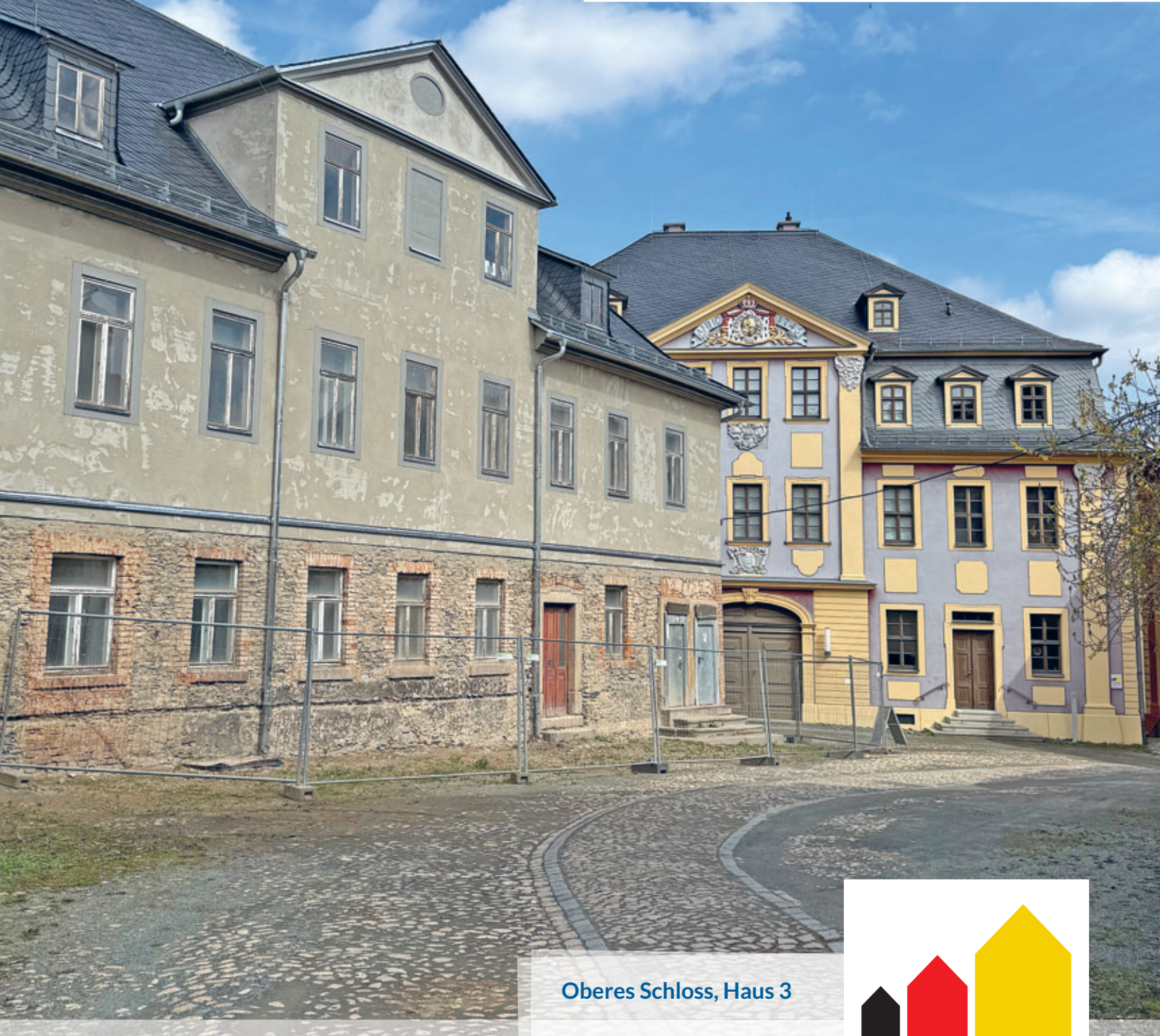
Oberes Schloss, Haus 3