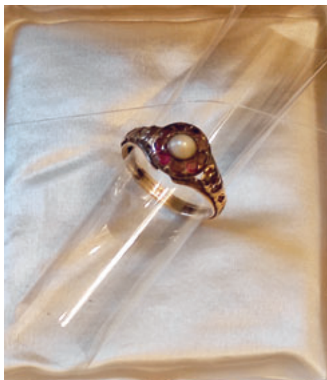
Goldener Bürgermeisterring mit mittig sitzender Elsterperle, umgeben von roten Edelsteinen, wahrscheinlich Granaten.

Seit dem 9. Mai ist er in der Kabinettausstellung „Magie der Perle“ im Sommerpalais zu sehen – der „Greizer Bürgermeisterring“, bekrönt mit einer kostbaren, seltenen Elsterperle. Denn Greiz trägt nicht nur den Beinamen „Perle des Vogtlandes“, tatsächlich wurde auch in der Weißen Elster bis zur Zeit der Industrialisierung nach Flussperlmuscheln gefischt. Die dabei gewonne-