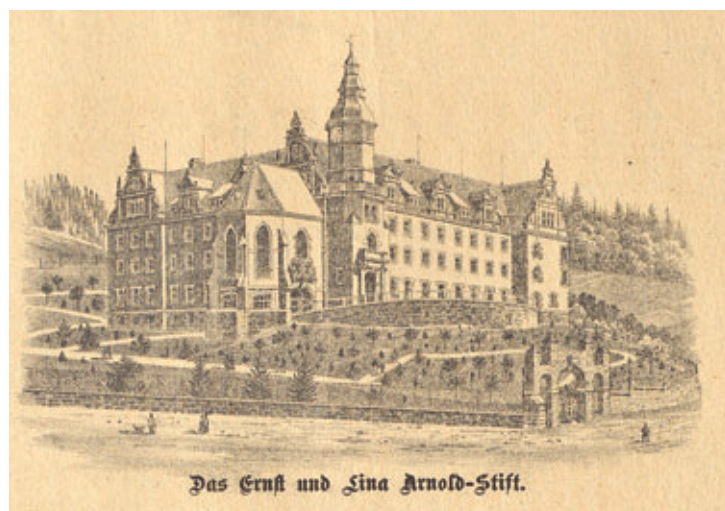
Das Ernst und Lina Arnold-Stift.